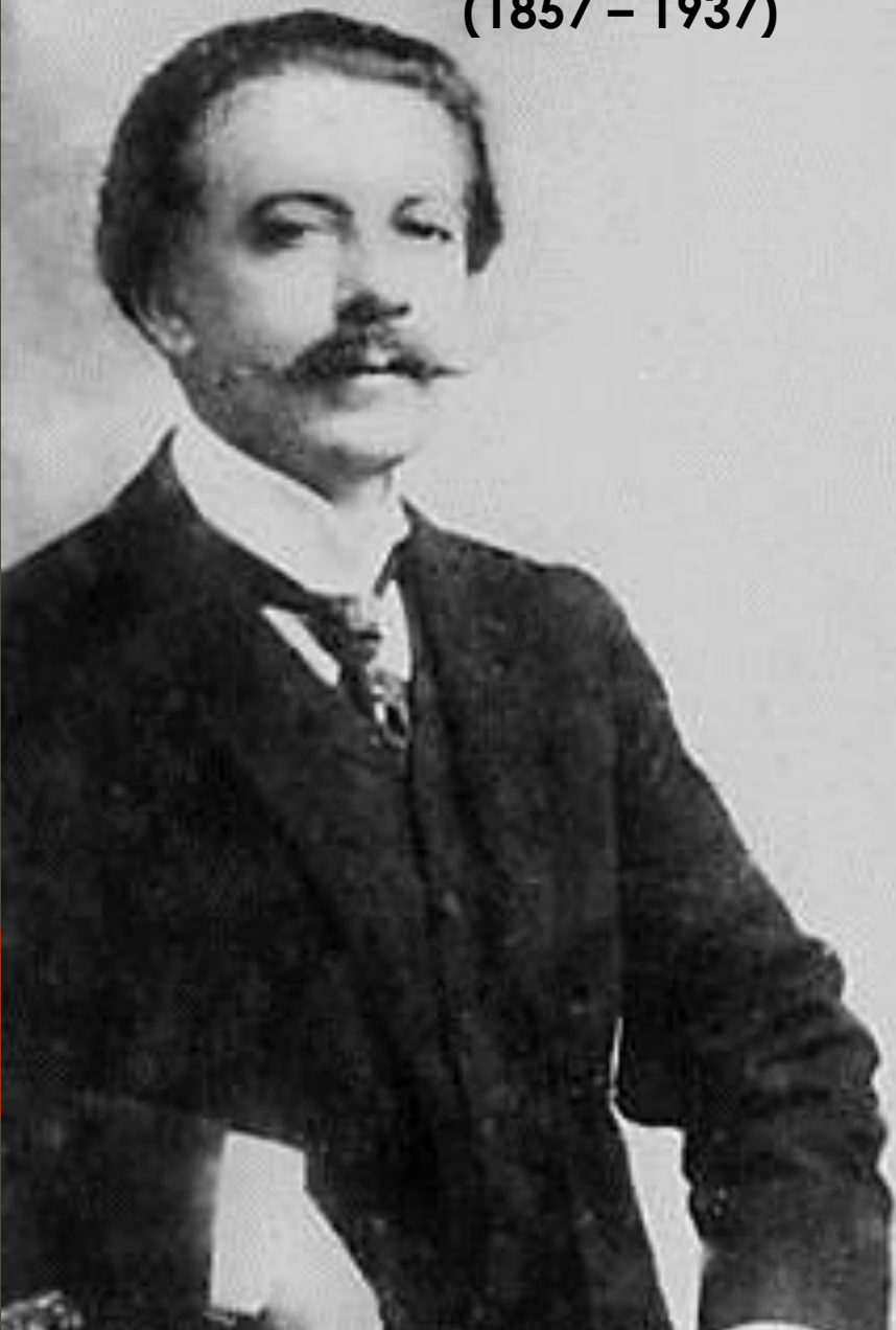
ALBERTO DE OLIVEIRA (1857 – 1937)