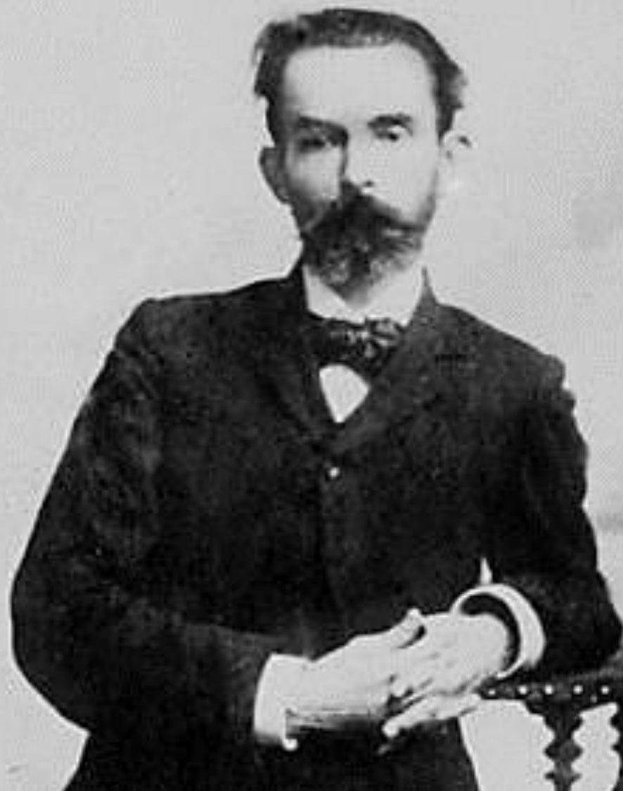
RAIMUNDO CORREIA (1860 – 1911)